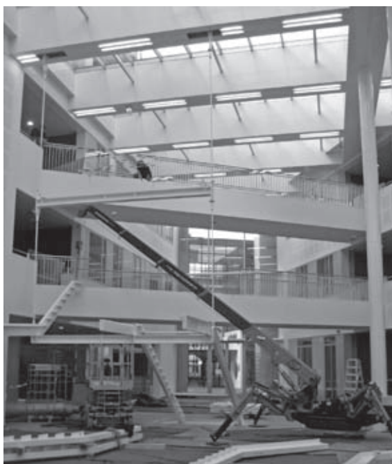
De laatste werkzaamheden

Bouwcombinatie Koopmans – Van Dijk is eind 2008 gestart met het project Ravelijn op het campus terrein van de Universiteit Twente. Het betreft de nieuwbouw voor de faculteit Management en Bestuur, korter gezegd M&B.