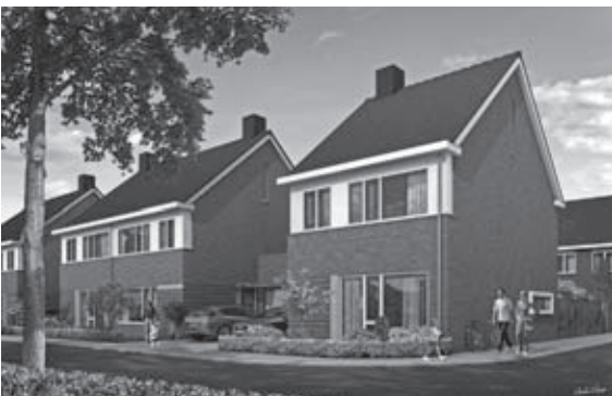
Type vrijstaand en twee-onder-een-kap woningen