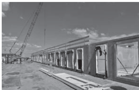
De wanden worden geplaatst