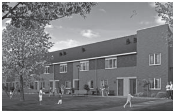
Rijwoningen type A