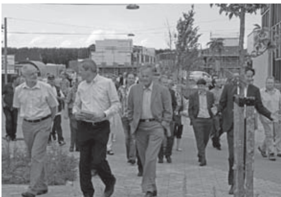
Bewondering over 'De Verwondering'