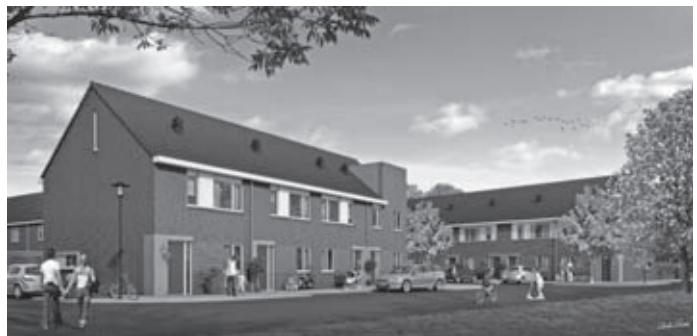
Rijwoningen type B en C

Inmiddels is het bouwrijp maken voltooid en wordt begin oktober gestart met de bouw van 15 starterswoningen, 42 eengezinswoningen, 22 twee-onder-een-kap woningen en 2 vrijstaande woningen. De herinnering aan het verleden wordt in stand gehouden