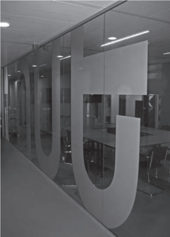
Eén van de vergaderruimten