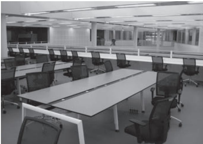
De entresol, het studielandschap