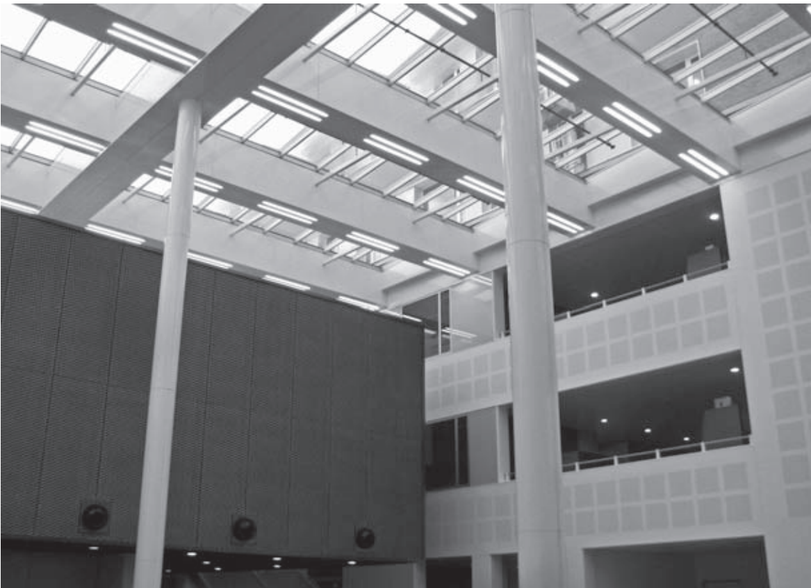
Veel licht en ruimte