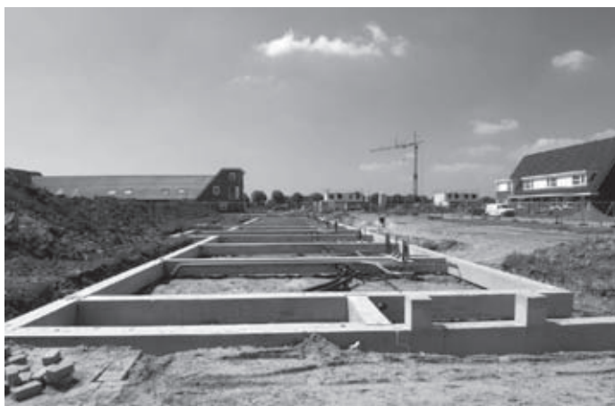
De fundering ligt er

In Zeewolde zijn wij 22 koopwoningen aan het bouwen in opdracht van Woonpalet. Wij zijn gestart in week 18 van dit jaar.