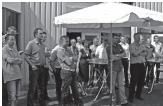
Heerlijk weer en gezelligheid met collega's