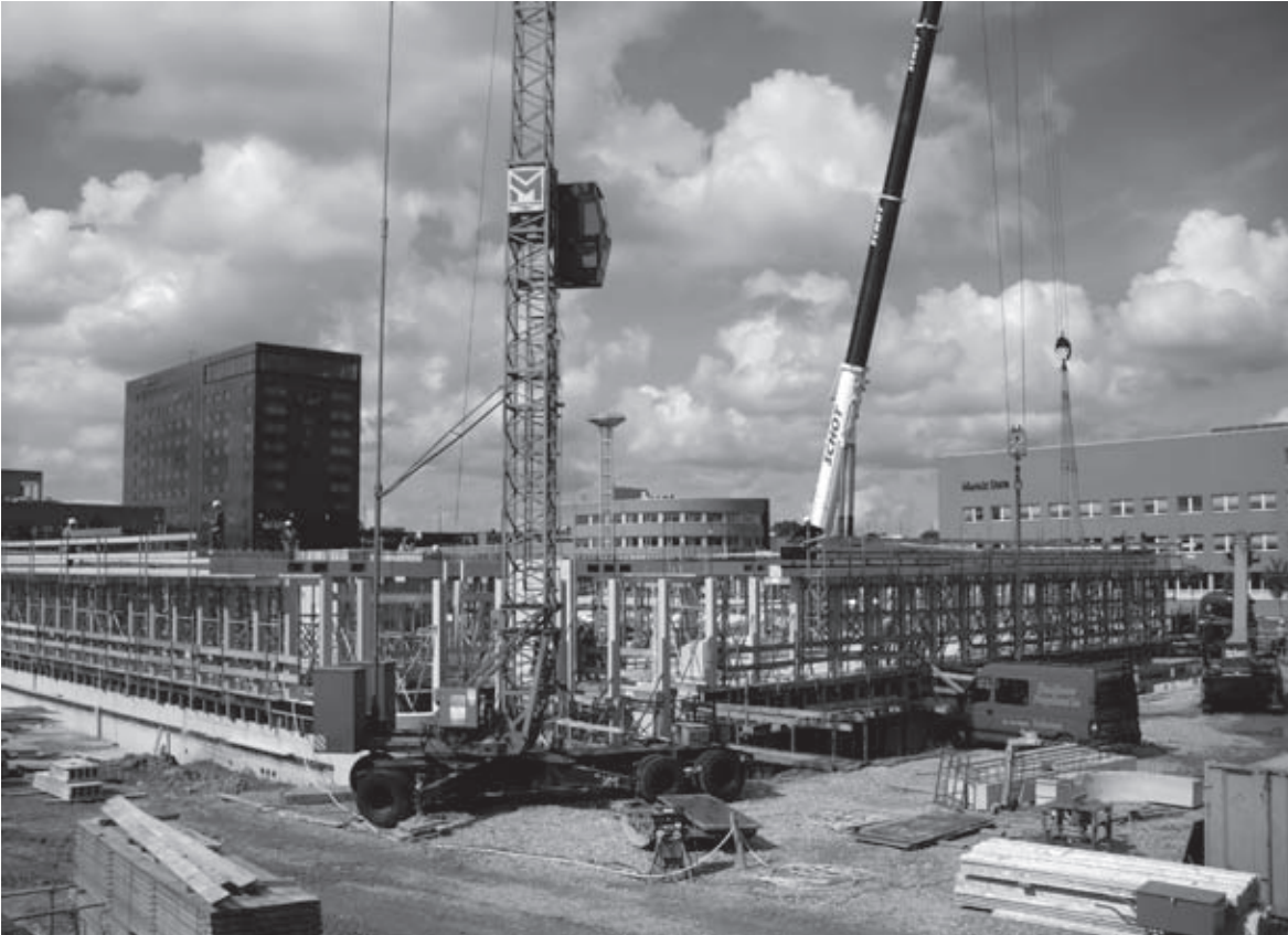
Het opbouwen is begonnen