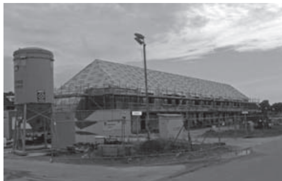
Wind- en waterdicht