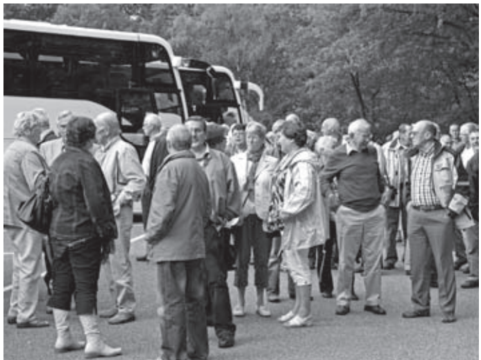
De ambassadeurs zijn klaar voor vertrek

Rond negen uur kwam de eerste bus aanrijden bij restaurant 'Pijnappel' in Klarenbeek. Natuurlijk waren de eerste gasten er al een half uur eerder, want te laat komen op zo'n mooie dag is niet de bedoeling. Om half tien stonden de drie touringcarbussen klaar en kon na koffie met krentenwegge en het openingswoord de dag starten. Na een korte toespraak van Hans Smit werd bekend gemaakt dat de dag ingevuld zou worden bij het Openluchtmuseum in Arnhem. Daar werden de bezoekers door acht gidsen over het