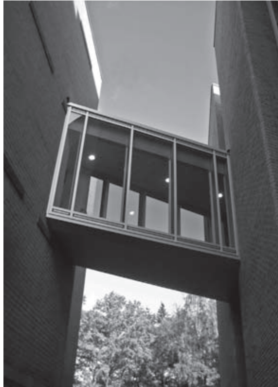
De verbindingsbrug aan de buitenzijde