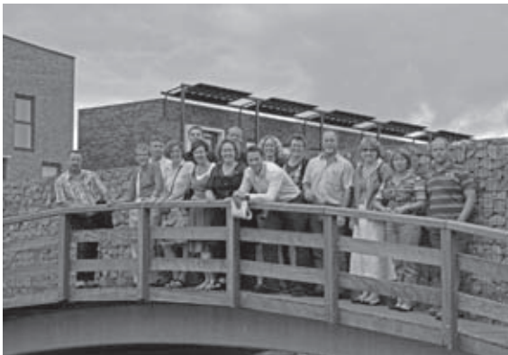
Collega's genieten tijdens de zomerbijeenkomst

Een groot voordeel van dit soort bijeenkomsten is dat je dan veel collega's uit den lande spreekt waarmee je normaliter geen contact hebt. Hieruit bleek eens te meer dat het van belang is dat wij als OR-leden aanwezig zijn bij dit soort gelegenheden. Wij als OR hopen dan ook dat jullie in groten getale aanwezig zullen zijn bij de nog te organiseren kerstbijeenkomst ergens in het land, zodat wij met elkaar van gedachten kunnen wisselen.