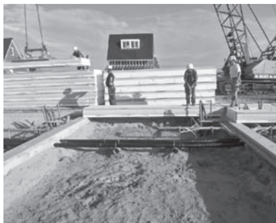
De begane grondvloer wordt gelegd

Een korte toelichting van onze werkzaamheden: