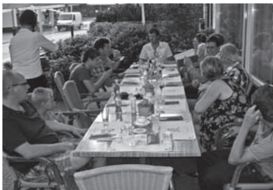
Een gezellig etentje op het terras