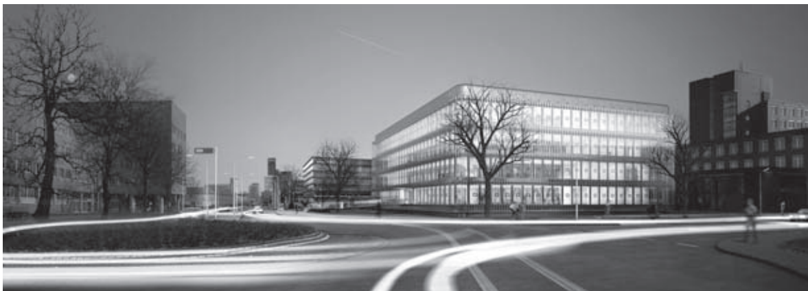
Het transparante ontwerp