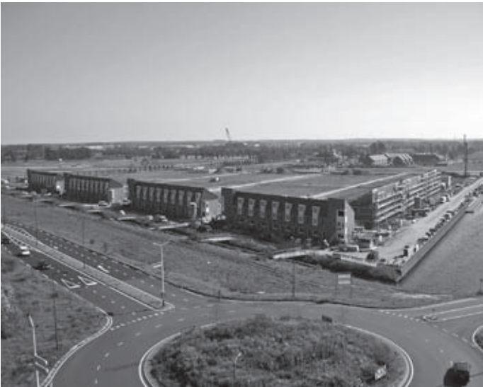
Het begin van de nieuwe wijk is er

In Veenendaal-Oost wordt een nieuwe wijk gerealiseerd met ongeveer 3.200 woningen. De eerste woningen zijn onderdeel van De Hoofse Rading, ideaal gelegen aan de rand van De Hoven. Voor Opus projecten en Latei projectontwikkeling heeft Koopmans de eer om een van de eerste projecten neer te zetten in het nieuwe plangebied. Het gedeelte dat gebouwd wordt vormt de begrenzing van De Hoven. Alle woningen hebben vrij uitzicht. De vier verschillende types (Traverse, Courtine, Lunet en Palissade) zijn duidelijk 'familie' van elkaar maar hebben ook een eigen karakter.