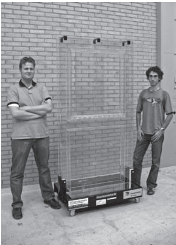
De trotse studenten bij hun ontwerp