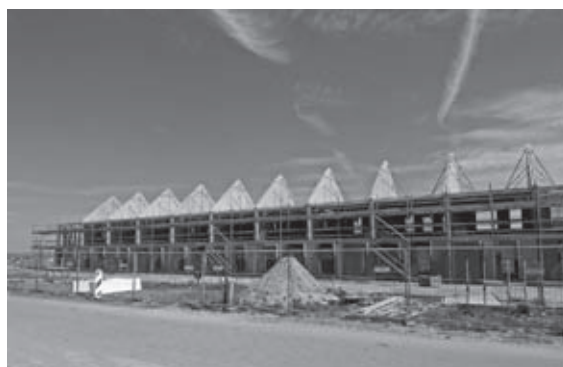
De woningen krijgen vorm