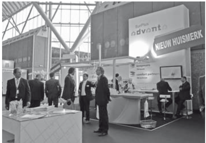
Het begint met een goede uitstraling

Meer informatie: www.remonde.nl www.surplusadvanta.nl