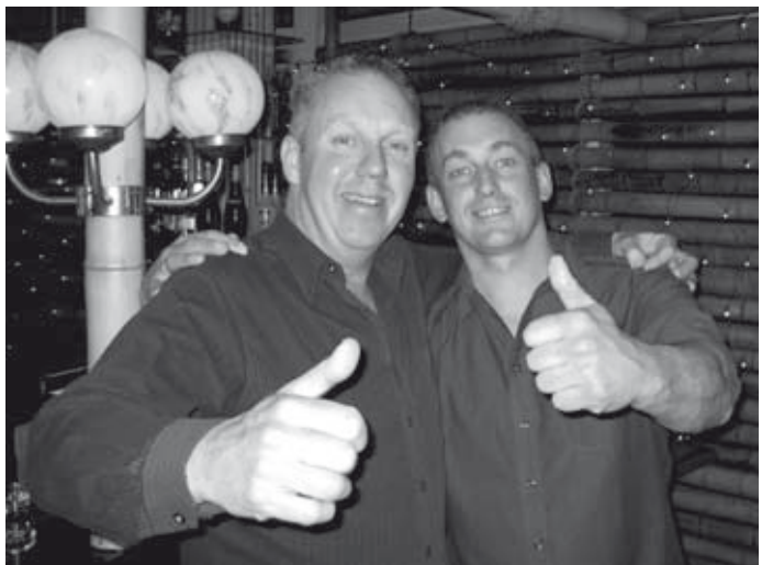
De sfeer zeer gemoedelijk