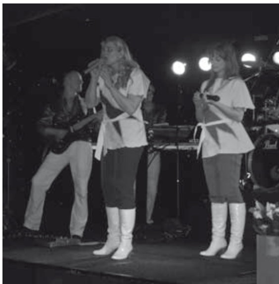
En de band goed bij stem