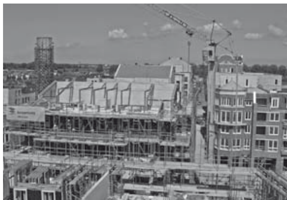
Overzicht op blok 3 vanuit de kraan bij blok 4

Het metselwerk van blok 3 is enigszins speciaal door de kruizen in een aparte kleur die in de gevel zitten en de sprongen in de gevel. Dit is dus opletten geblazen voor de metselaars en de uitvoerders. Daarnaast zitten er behoorlijk veel prefab bandjes en afdekkers in de gevel en een gekleurde prefab plint op de begane grond. De vele tooglateien worden prefab gemaakt (prefab beton met steenstrips) of in het werk middels schenkels gemetseld. De staalconstructie van het dak zal traditioneel betimmerd en met pannen afgedekt worden. De gevel van blok 4 wordt in verschillende kleuren opgemetseld met de nodige prefab bandjes erin. Als dakrand komt hier een prefab betonnen band overheen. De toren heeft net als het andere blok een prefab gekleurde plint met daarbovenop metselwerk. Het dak wordt ook hier op een staalconstructie uitgetimmerd en bekleed met leipannen. Het hoogste punt van het centrumplan wordt de zinken torenspits op de toren.