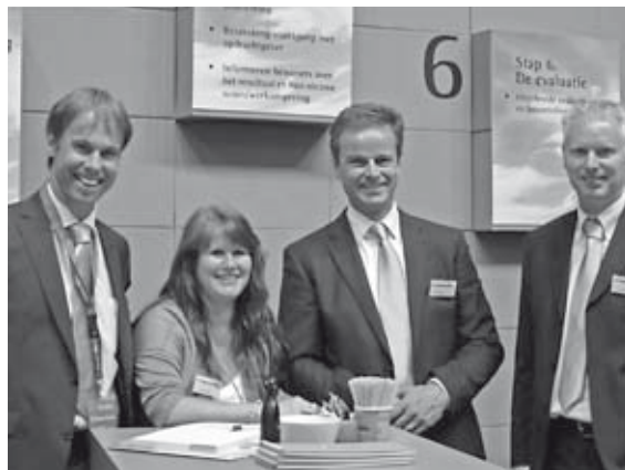
Rémonde-bezetting in vol ornaat