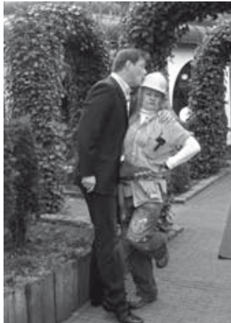
De ontvangst was zeer hartelijk