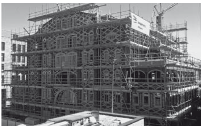
De achtergevel van blok 3 met patroon op hoogte