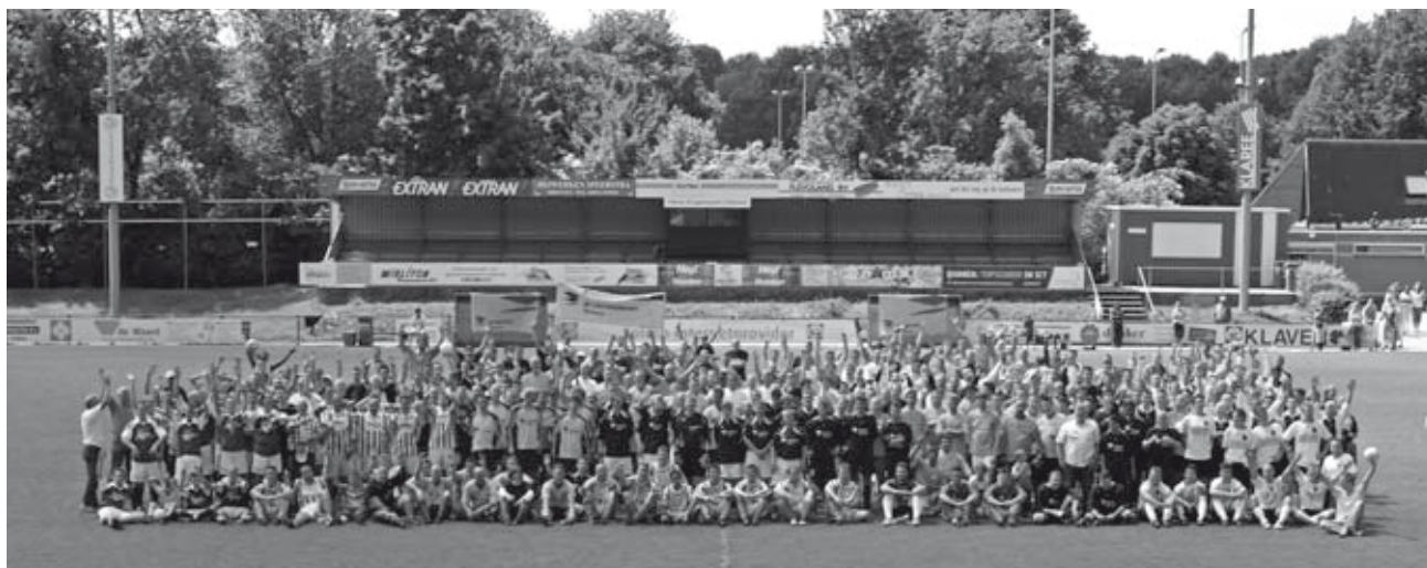
Met 28 teams een heel veld vol

Dag: zonovergoten zaterdag 12 juni 2010 Locatie: Sportpark voetbalterrein ASV Dronten Programma: TBI Koopmans Voetbaltoernooi Samenstelling: 28 teams, 20 recreatie en 8 prestatieklasse Toejuichers: ruim voldoende Aantal voeten, incl bezoekers: ruim 1000 Sfeer: willen winnen en sportief blijven Gele kaarten: geen Doelpunten: erg veel Winnaars: uiteindelijk maar 1 per klasse: Prestatie: FriJado, recreatie: ASV Dronten Verliezers: geen Foto's: moelijke keuze maar kijkt u mee voor een impressie van de dag!