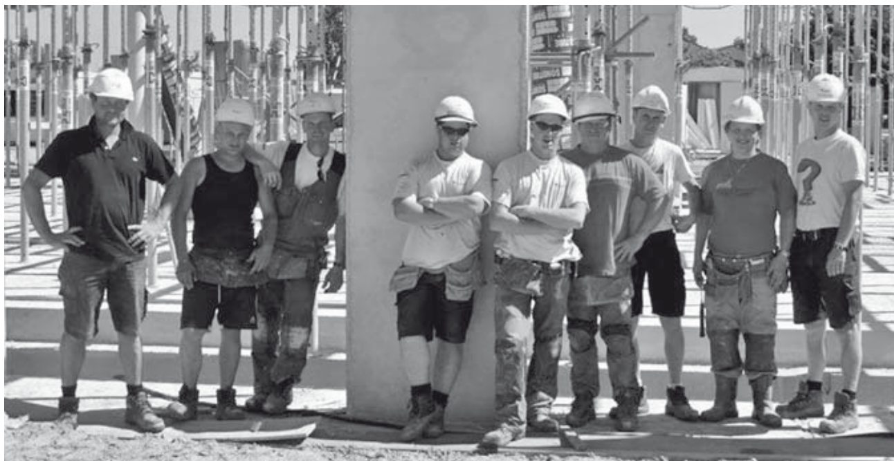
De collega's op de werkvloer

In maart van dit jaar is Koopmans Bouw Enschede in combinatie met Van Dijk Bouw uit Enschede gestart met de realisatie van het project 'De Meerwaarde' in Barneveld. Het werk behelst de bouw van een nieuwe VMBO school van circa 15.500 m 2 bruto vloer oppervlak, verdeeld over een drietal bouwlagen. Voor een naast de school gelegen tuinbouw kas maken we de fundatie en vloer. In de school wordt straks onderwijs gegeven in diverse richtingen zoals verzorging, autotechniek, bouw, landbouw en metaal. Dus naast onderwijslokalen worden ook vele verschillende praktijklokalen gerealiseerd.