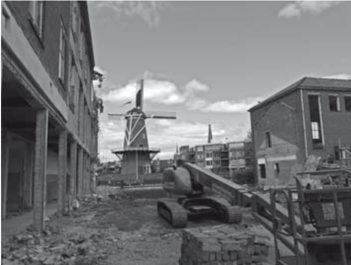
De sloop is in volle gang

Na een lange en intensieve periode van voorbereiding is de start van de bouw door de bouwcombinatie Koopmans Enschede / WAM & van Duren Winterswijk een feit.