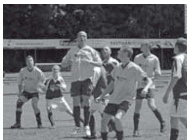
Op weg naar een kopbal