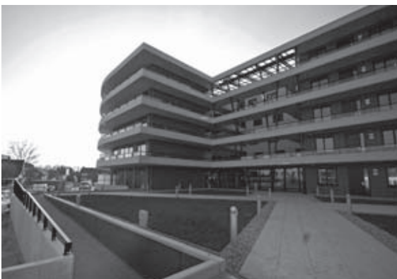
Mooi contrast tussen de ronde en rechte vormen