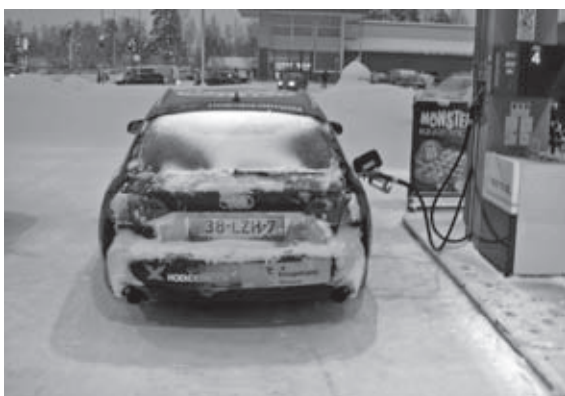
De audi had regelmatig dorst tijdens de tocht