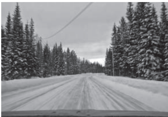
Naaldbomen en besneeuwde wegen in Finland