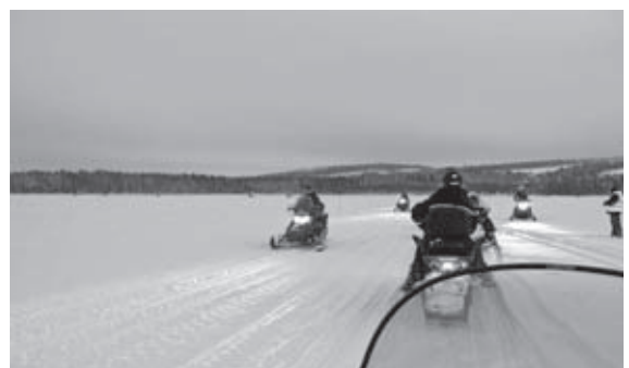
Met sneeuwscooters over het ijs en door de bossen