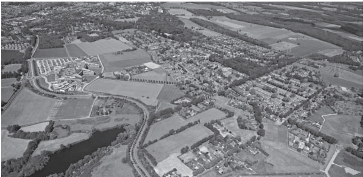
Luchtfoto van Schalkhaar, rechtsonderin gaat het gebeuren