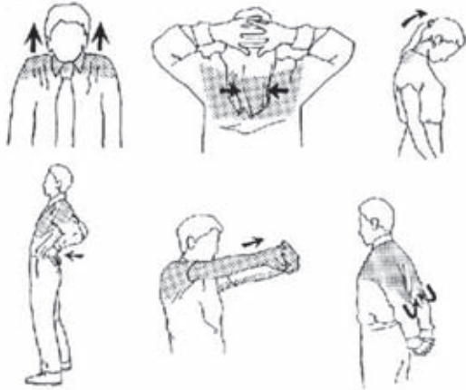
Rek- en strekoefeningen