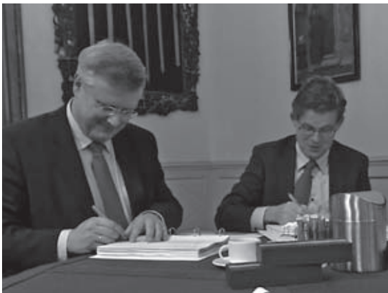
De heren tekenen de realisatieovereenkomst

Vanwege de economische crisis wordt er in fasen gebouwd, te beginnen in het deelgebied Wijtenhorst, in het noordoosten bij sportcomplex Horsterhoek. In de eerste fase worden door woningstichting De Marken ook een vijftigtal sociale huurwoningen gerealiseerd. Vanaf mei 2011 begint het bouwrijp maken, waarna in oktober het werk begint. De eerste woningen komen in het voorjaar van 2011 in de verkoop. De start van de Douwelerleide hangt af van de voortgang in de Wijtenhorst. De laatste uitbreiding van Schalkhaar dateert van 1994 (Haarmansenk/Koeland).