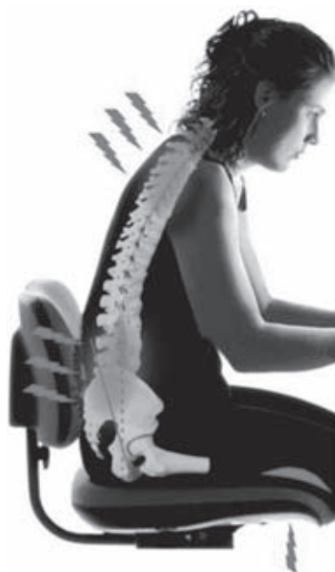
Niet ideale werkhouding