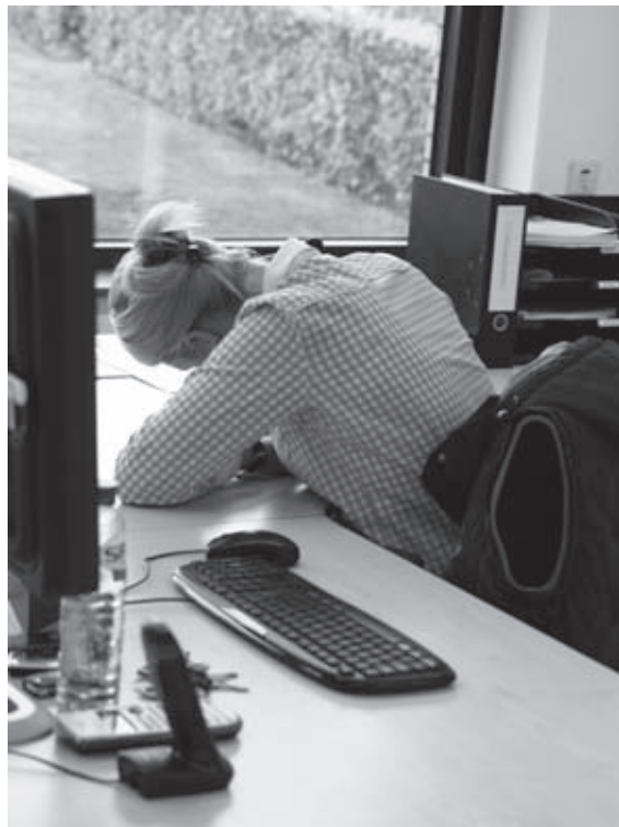
Verkeerde houding, maar het zit zo lekker...