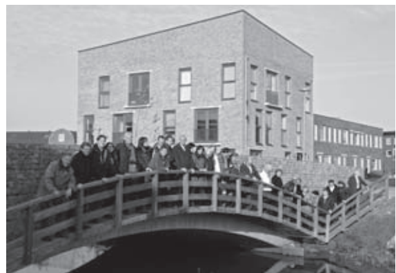
De staf in Almere