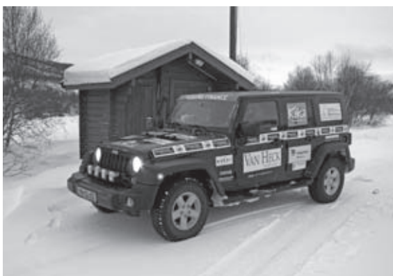
Henk neemt een kleine pauze in Noorwegen