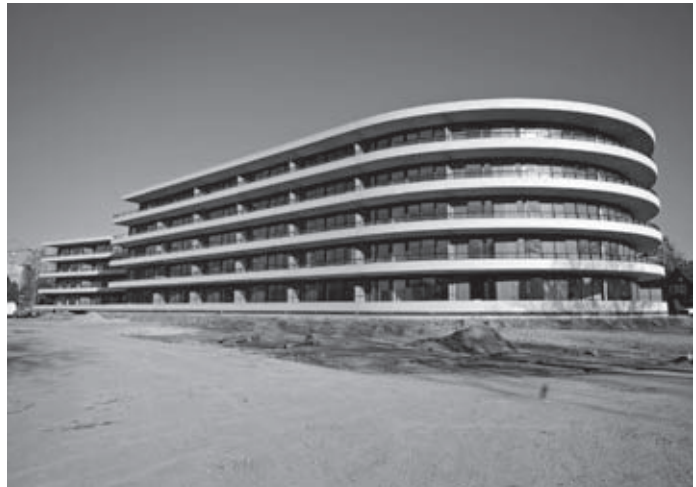
Het is een prachtig gebouw geworden

Het project bestaat uit een half verdiepte parkeerkelder met hierop vijf bouwlagen. Door de asymmetrische vorm van het gebouw zijn er in totaal vijftien verschillende typen appartementen ontstaan. Het casco bestaat uit holle wanden in de kelder, (volledig) in het werk gestorte wanden op de verdiepingen met de schilvloeren als verdiepingsvloeren. De gevels zijn uitgevoerd in HSB-elementen met kunststof kozijnen en een cementgebonden gevelplaat als afwerking. Kenmerkend voor dit project is de grote hoeveelheid prefab beton die wij hebben toegepast. Het overgrote deel hiervan is uitgevoerd in geel beton en zit aan de buitenzijde van het gebouw, in de vorm van balkons, galerijen, loopbruggen en borstweringen. De balkons en galerijen zijn volledig vrijhangend door het 'Isokorf-systeem'. De schuin (taps) lopende onderzijde van de balkons/galerijen en de verschillende uitkragingsmaten hebben voor een uitdagend bouwproces gezorgd. Op de balkons/galerijen zijn prefab betonnen borstweringen aangebracht. Deze borstweringen zijn af fabriek