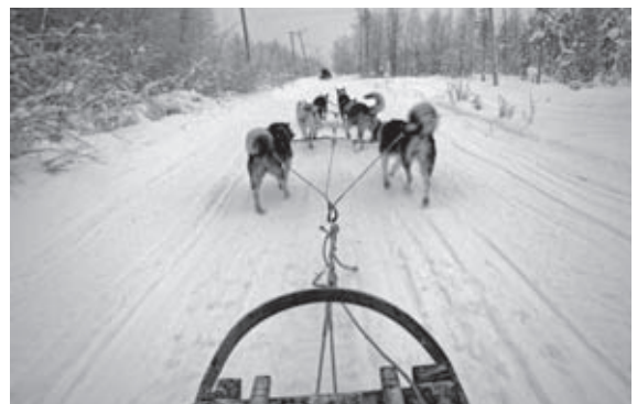
Husky's voor de slee

De gereden route: Nederland → Duitsland → Denemarken → Zweden → Noorwegen → Zweden → Finland → Estland → Letland → Litouwen → Polen → Duitsland → Nederland.