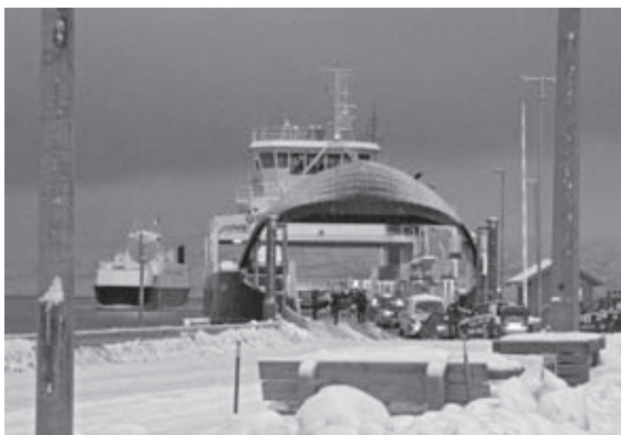
In de rij voor de veerpont in Noorwegen