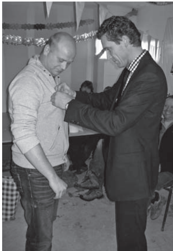
Wel voorzichtig, hè?