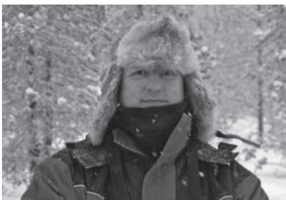
Na vele jaren weer haar op mijn hoofd