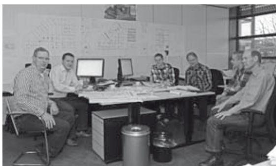
De collega's in hun 'eigen' Waterlandpleinkantoor

En nog vele andere collega's die vanuit hun staf-functies nauw betrokken zijn bij dit project