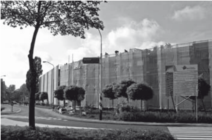
Groen-paars ingepakte gevels

Wij hebben de drie werken verkregen uit een aanbesteding, wat in deze tijden betekent dat wij een meer dan scherpe prijs hebben ingediend om te winnen. De uitslag was positief en motiverend voor ons, mede omdat Rijssen, waar 24 grote en kleine aannemers zijn gevestigd, nog een 'witte vlek' was in ons werkgebied. Het project is een uitdaging voor ons omdat het drie verschillende werken zijn (drie opdrachten, drie bestekken en drie begrotingen) waarvoor in totaal dezelfde bouwtijd, zes kalendermaanden, staat vastgesteld als voor elk van de drie werken afzonderlijk. Viverion had de aanbesteding zo gehouden dat op de drie complexen ook drie aannemers hadden kunnen werken.