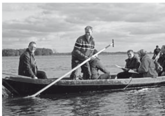
Ook op groter water