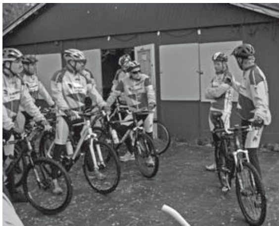
Ga je nu wel of niet op de fiets?