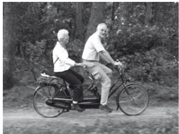
Kwali-tijd voor thuis