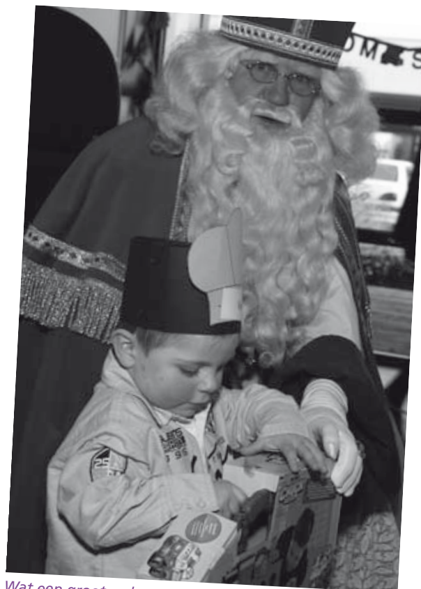
Wat een groot cadeau