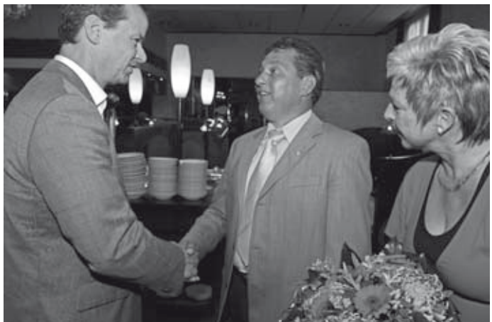
En na de speech de speld, bloemen en felicitaties