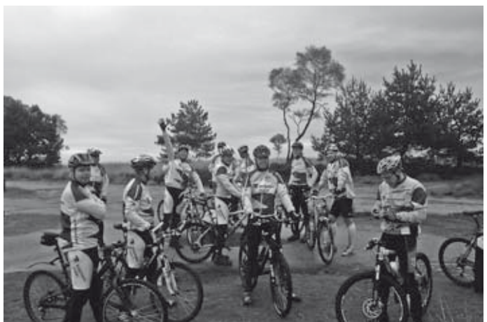
Even pauze in de prachtige natuur

Na de tocht en na het douchen werd er gezamenlijk een borreltje gedronken en gegeten. Deze jaarlijkse tocht kan ik bij iedereen die kan mountainbiken aanbevelen. Langs deze weg wil ik iedereen bedanken die heeft meegewerkt aan deze prettige middag. De bijgaande foto's geven een impressie van de middag en het enthousiasme van de mensen om de tocht te fietsen.