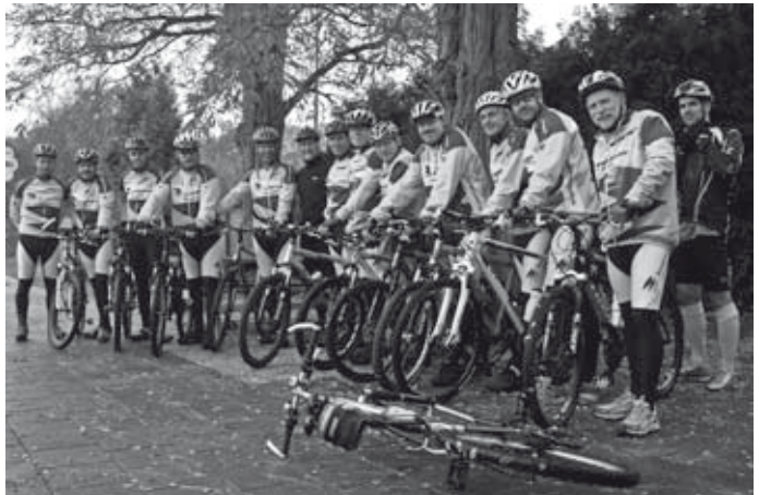
Fitte en getrainde fietsers