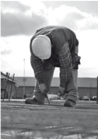
Gebukte bouwvakker

In juni 2010 heeft het onderzoeksteam van Saxion het gezondheidsonderzoek onder bouwplaatspersoneel afgerond. Uit de landelijke PAGO-uitkomsten komt duidelijk naar voren dat de bouw meer dan gemiddeld overgewicht kent. Ook bij de bouwplaatscollega's binnen Koopmans is overgewicht een van de grootste oorzaken van gezondheidsproblemen zoals hart- en vaatziekten of gewrichtsklachten. We vroegen de studenten voor ons te onderzoeken of de maatregelen die Koopmans nu al neemt in het kader van gezondheidsbevordering, voldoende zijn en wat we nog meer zouden kunnen doen.