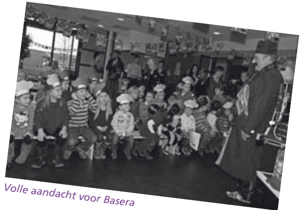
Volle aandacht voor Basera