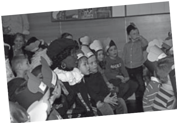
De jongste Piet