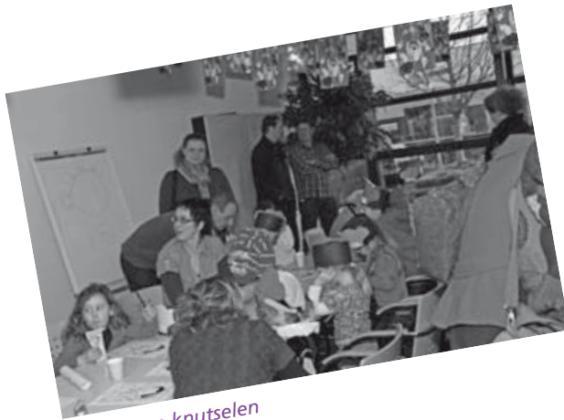
Kleuren en knutselen