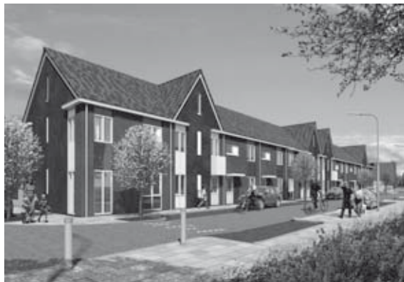
12 woningen Het Vledder

De woningen worden in twee geveltypologieën gebouwd. De koopwoningen, aan de rand van het plan, met gevels die aansluiten bij de bestaande woningen. De woningen die wat meer naar het centrum gericht zijn krijgen verschillende gevels. Hier wordt gevarieerd met verschillende kleuren metselwerk, kozijnafmetingen en goottypes. Op deze manier krijgen deze woningen een relatie met de historische binnenstad van Meppel. De mogelijkheden van het SurPlus® systeem worden volop benut, want naast de verschillende geveltypes, komen ook verschillende beukmaten en woningdieptes voor.