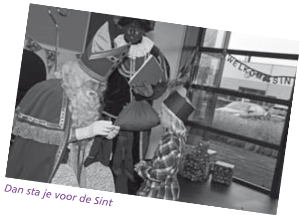
Dan sta je voor de Sint