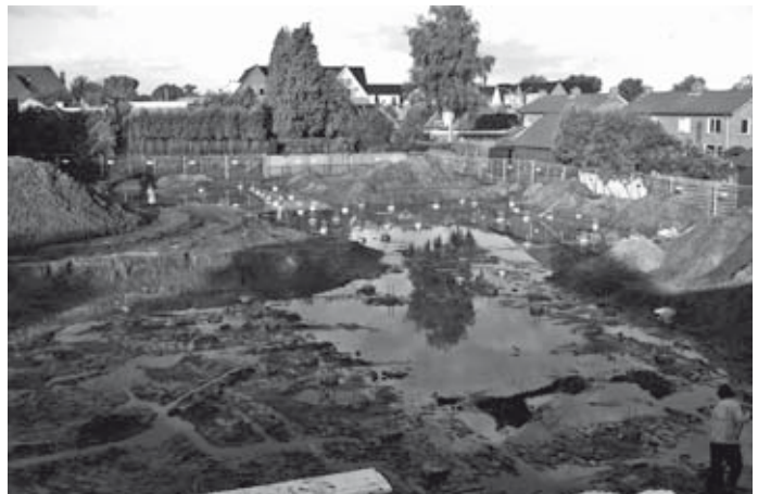
Een beetje water in de bouwput...