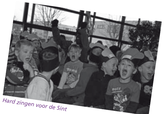
Hard zingen voor de Sint