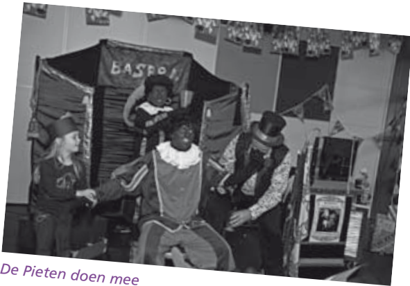
De Pieten doen mee