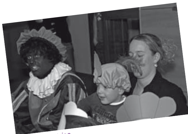
Ha... ha... hatsjoe