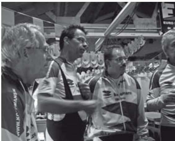
Nu nog ongeschonden en relaxed