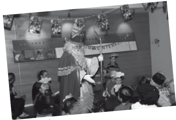
De Sint is er!