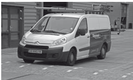
Voorzichtig over de drempel