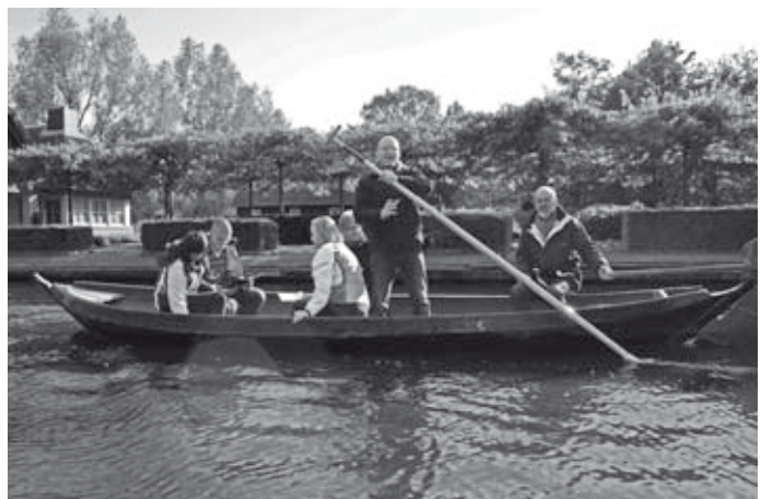
Het punteren kan beginnen