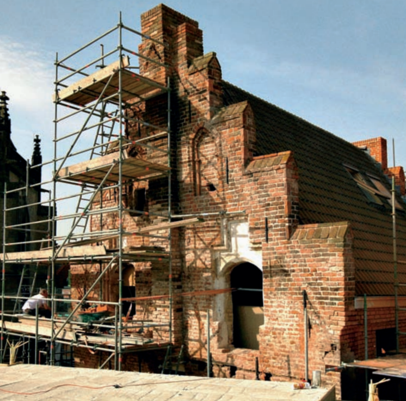
Lange Bisschopstraat/Kleine Poot – Deventer