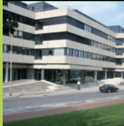
Paleis van Justitie – Arnhem

De optimale vorm van onderhoud is het resultaatgericht vastgoedonderhoud. Een fraaie vorm van technisch en financieel meerjarig beheersbaar onderhoud. De doelstelling is onze opdrachtgevers zorg uit handen te nemen en het onderhoudsbudget te minimaliseren.