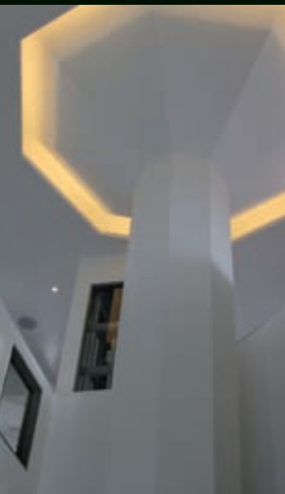
Poldertoren – Emmeloord