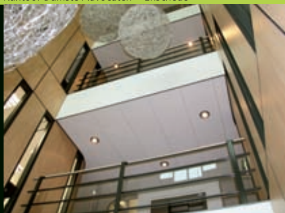
Kantoor Damsté Advocaten – Enschede

Vastgoedbeheer is slechts één aspect binnen de brede dienstverlening van Koopmans Service & Onderhoud. Hierin brengen wij adviezen uit over de reductie van de exploitatiekosten. Wij zorgen ervoor dat u minimale openthoud heeft; door snel ter plaatse te zijn! Onderhoud wordt daarmee beheersbaar en de schade wordt tot een minimum beperkt.