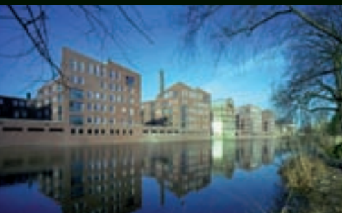
Raambuurt – Deventer