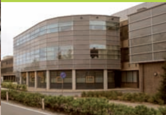
Diaconessenhuis – Meppel