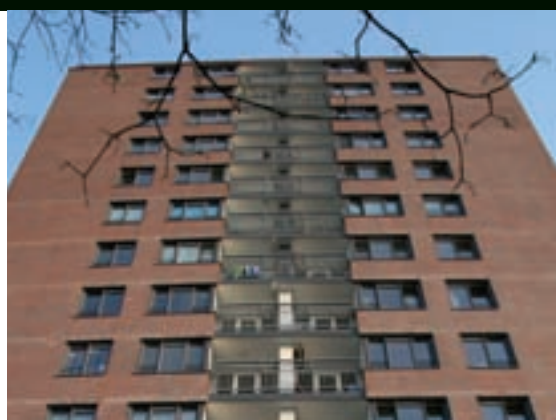
Waal- en Jekerstraat – Enschede