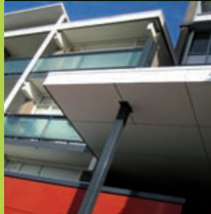
Markveldebrink – Enschede

Koopmans Service & Onderhoud heeft een ruime ervaring in dienstverlening, met het naar volle tevredenheid verhelpen van storingen en het uitvoeren van curatief en planmatig onderhoud. Voor meldingen van onze opdrachtgevers zijn wij het hele jaar vierentwintig uur per dag bereikbaar. Een hele zekerheid.