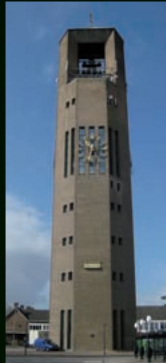
Poldertoren – Emmeloord

Als onderdeel van Koopmans Bouwgroep biedt Koopmans Service & Onderhoud opdrachtgevers een totaalpakket aan professionele dienstverlening. Voor een groot aantal woningcorporaties, zorginstellingen, overheden, vastgoedbeheerders, bedrijven en particulieren verzorgen wij het totale onderhoud aan gebouwen. Ook verrichten wij verbouwingen en uitbreidingswerkzaamheden. Van advies tot en met nazorg.