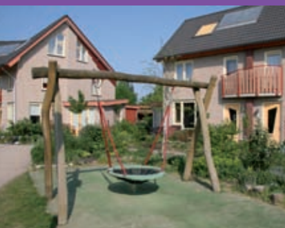
EOS – Leesten Oost-Zutphen / Co-productie met bewoners