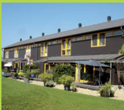
Feltaer – Deventer / Collectieve tuinen

Koopmans Projecten heeft een duidelijke visie op de ontwikkeling van binnenstedelijke- en uitleggebieden. Visies worden op inspirerende wijze vertaald naar een plan. Een plan dat zich in alle opzichten onderscheidt...maar uiteraard werkelijk te realiseren is, mede door solide financiële onderbouwing. Ook zien wij een uitdaging in meer experimentele concepten.