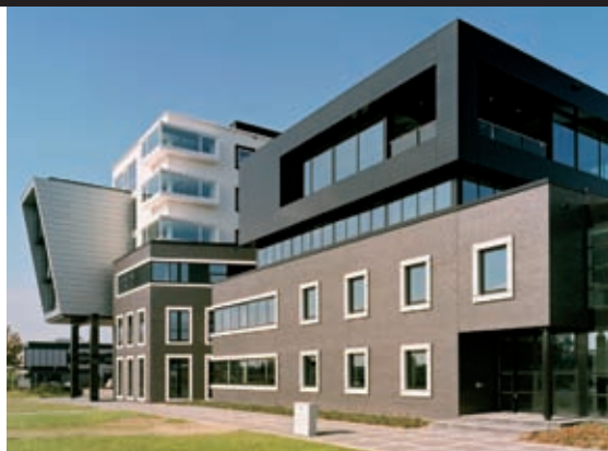
Walburgstaete – Zutphen

Naast uitbreidingslocaties stijgt het aantal ontwikkelingen in de binnenstad zeer snel. Met name de diversiteit binnen deze projecten stelt zeer hoge eisen aan alle betrokkenen bij het bouwproces. Coördinatie, aansturing en samenwerking zijn daarbij de sleutelwoorden.