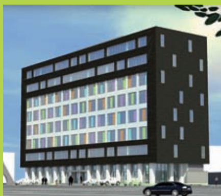
Belastingkantoor – Almelo / Bestaand kantoor upgraden tot energielabel A