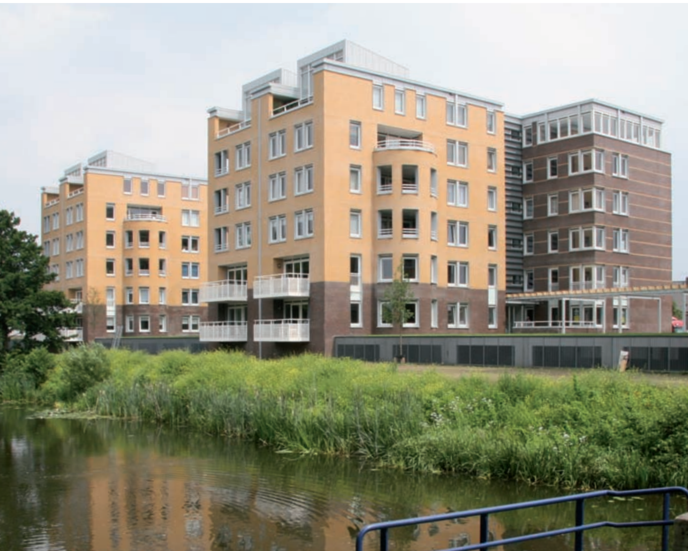
Ravel – Zutphen

Naast uitbreidingslocaties stijgt het aantal ontwikkelingen in de binnenstad zeer snel. Met name de diversiteit binnen deze projecten stelt zeer hoge eisen aan alle betrokkenen bij het bouwproces. Coördinatie, aansturing en samenwerking zijn daarbij de sleutelwoorden.