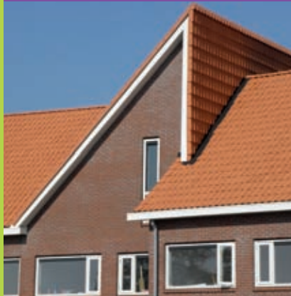
Kloosterkamp – Duiven