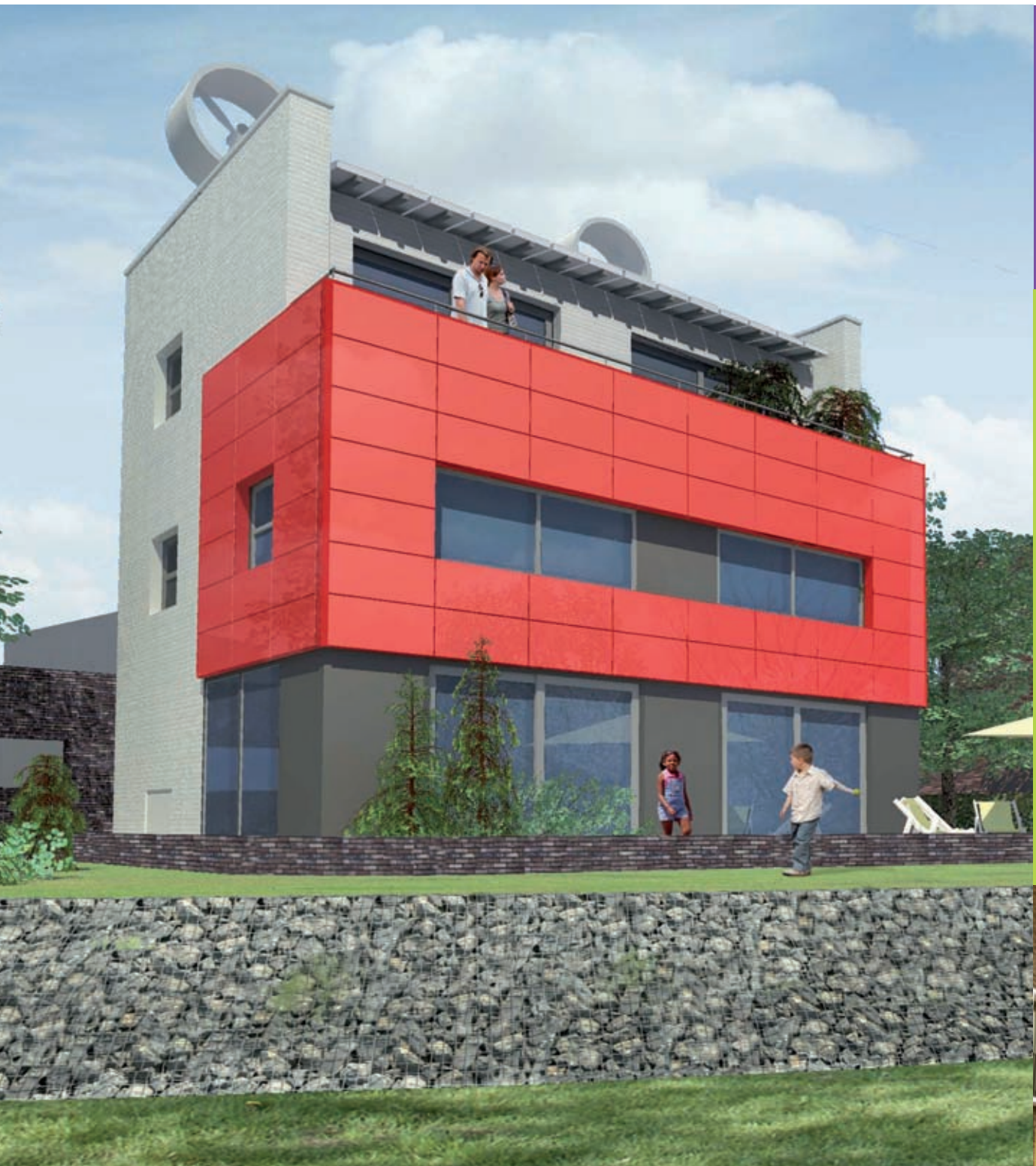
CO 2 -neutrale woning – Almere