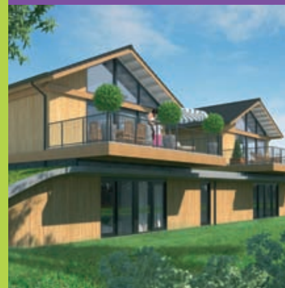
Wijnbergen – Doetinchem

Inspelen op de veranderende markt door het ontwikkelen van creatieve oplossingen kenmerkt Koopmans Projecten. Een goed voorbeeld is het SurPlus®-concept dat geschikt is voor betaalbare woningen en gestapelde bouw. Daarnaast geven wij veel aandacht aan duurzaam en gezond bouwen. Dit heeft geresulteerd in SurPlus® ECO, de energiezuinige variant van het SurPlus®-concept.