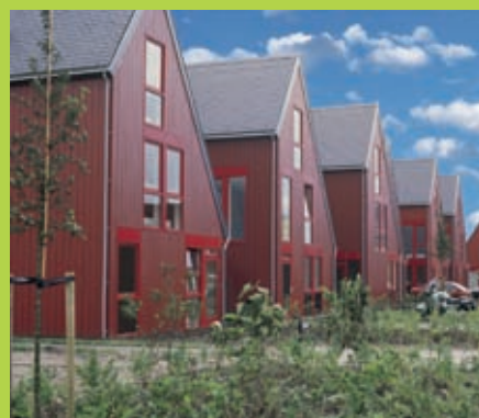
Multiple Choice – Almere / SEV predikaat IFD