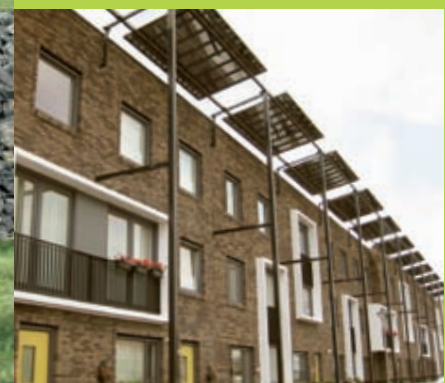
De Verwondering – Almere